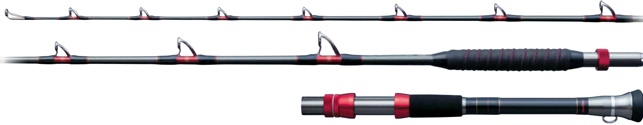
コマンドX LTディーブドラゴン(バット込)