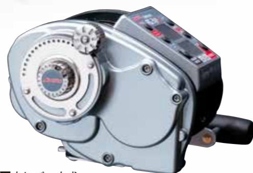
■左レバー方式 左レバー方式採用によりハンドルでの巻き取り時にもドラッグ調整が可能です。