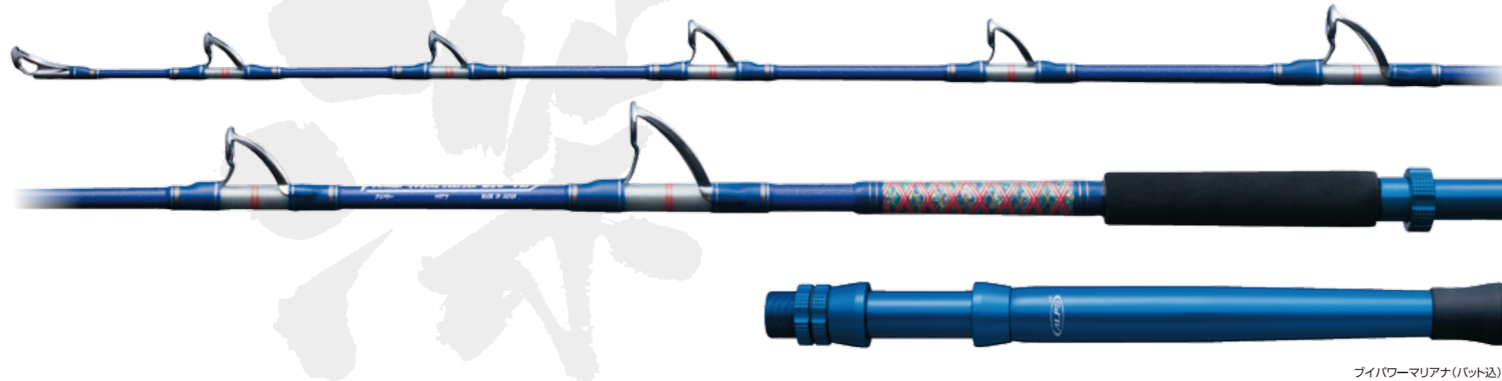
バイパワーマリアナ(バット込)

専門メーカーがたどり着いた、2本の深海釣り専用ロッド。 グラス素材100%にこだわった「粘り」と「腰」は、過酷な状況にも耐えうる性能を備え、 深海に咲き乱れる“華たち”を海面へと導いてくれます。