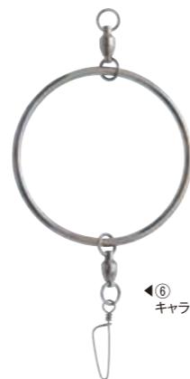
⑥ キャラマンリングI型