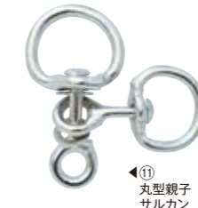
⑪ 丸型親子 サルカン