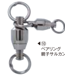
⑩ ベアリング 親子サルカン