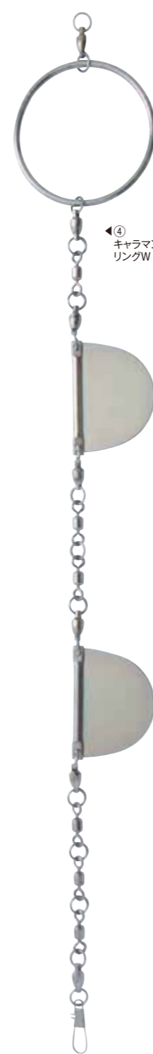
④ キャラマン リングW