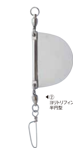
② ヨリトリフィン 半円型