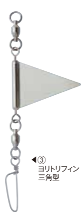
③ ヨリトリフィン 三角型