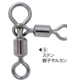
⑨ ステン 親子サルカン