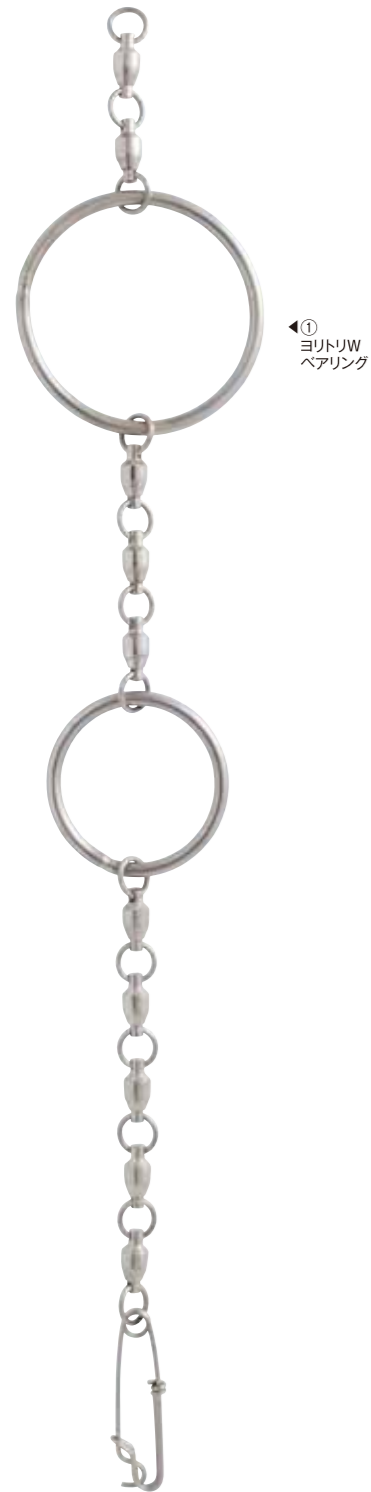
① ヨリトリW ベアリング