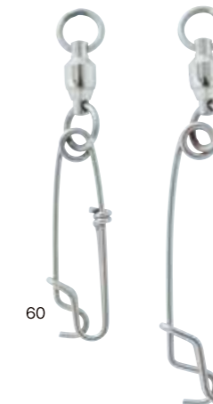
⑬ ブランチ ベアリング