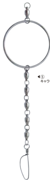
⑤ キャラマンリングII型